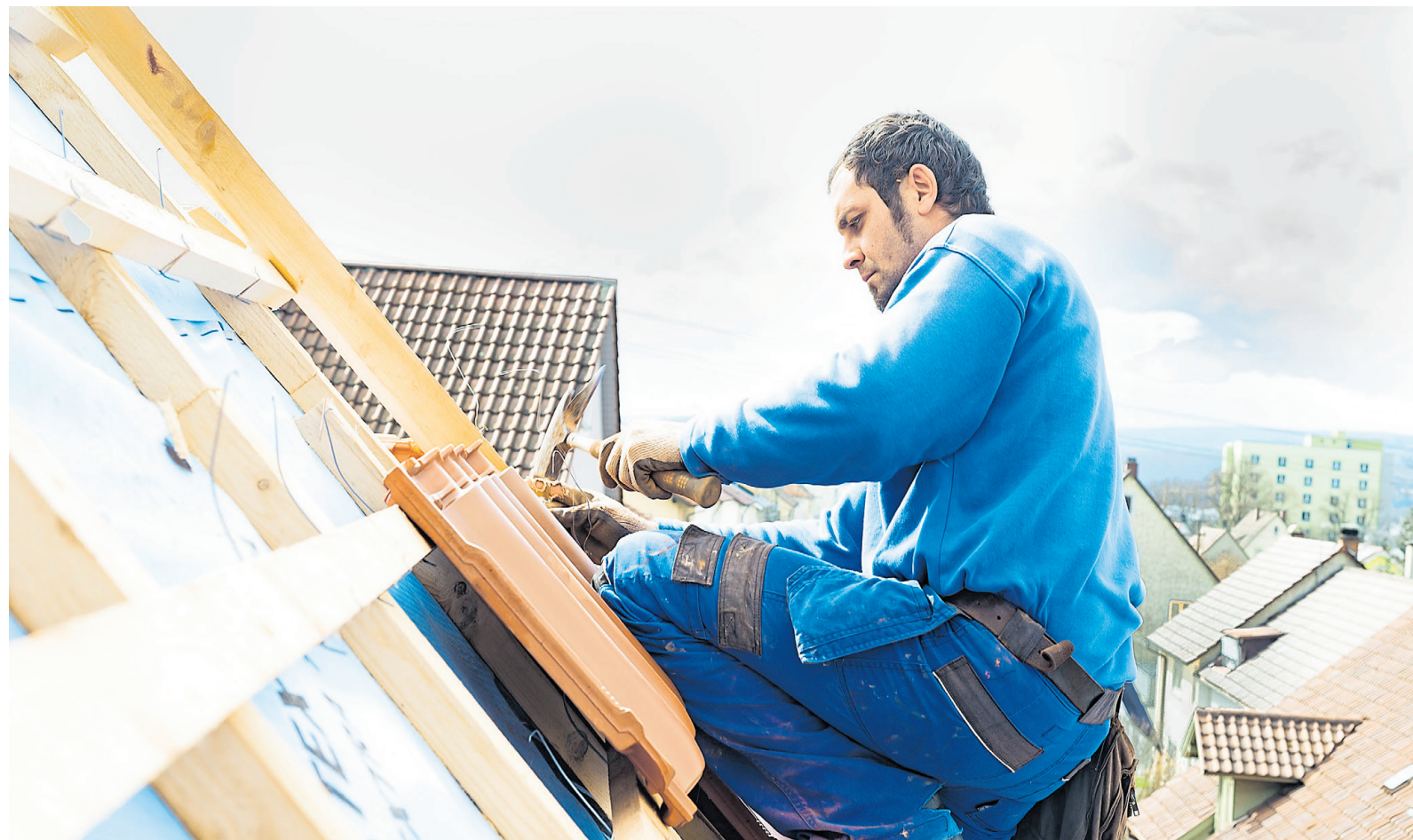
Gut zu tun: Zwar sinkt die Stimmung im nord-, ost- und mittelhessischen Handwerk, aber die Betriebe der Bau-Handwerke haben nach wie vor volle Auftragsbücher und sind auch auf längere Sicht gut ausgelastet.

Im Befragungszeitraum Juli bis September waren gut 91 Prozent der befragten Betriebe mit ihrer wirtschaftlichen Entwicklung zufrieden. Davon bewerten knapp 47 Prozent ihre aktuelle Geschäftslage mit „gut“, fast 43 Prozent mit „befriedigend“. Gegenüber dem letzten Herbstquartal ist das eine leichte Verschlechterung der Lageeinschätzung. Die Geschäftserwartungen gingen dagegen deutlicher nach unten: Die Zahl der Betriebe, die für die kommenden drei Monate einen Rückgang ihrer geschäftlichen Situation befürchten, ist in Jahresfrist von gut 11 auf fast 17 Prozent gestiegen, während die Zahl derer, die eine weitere Verbesserung