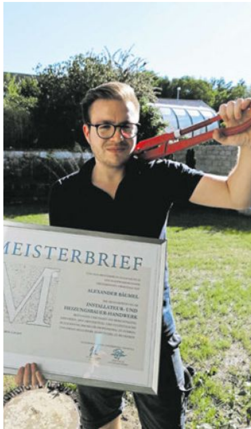
Installateur- und Heizungsbaumeister Alexander Bäumel aus Zeitlarn.