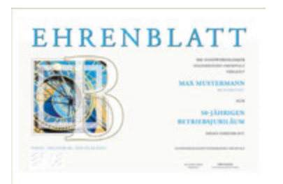
Das Ehrenblatt würdigt die jahrzehntelange Treue zum Handwerk.