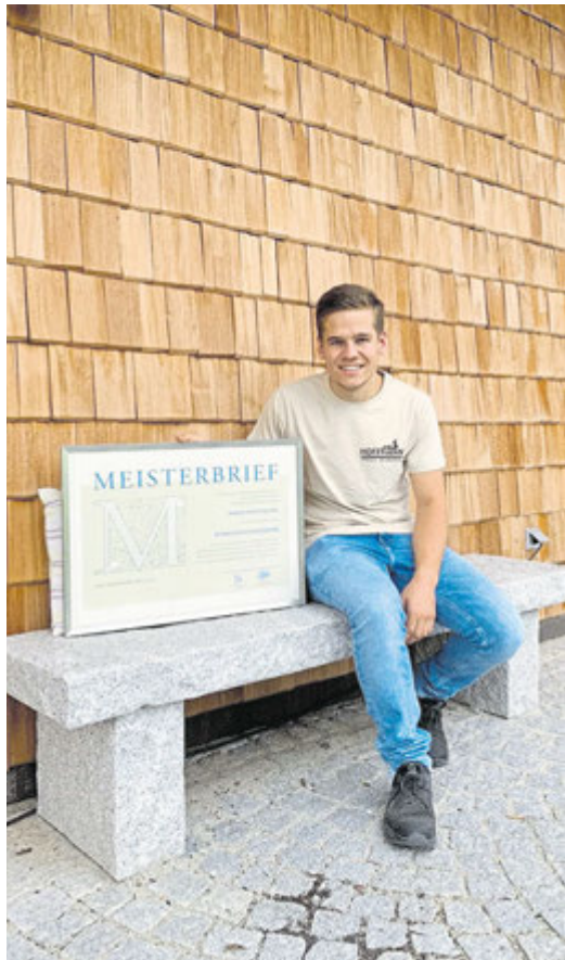
Schreinermeister Simon Hoffmann aus Waldkirchen.