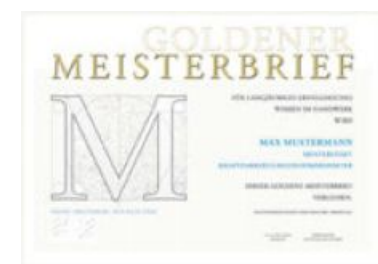
Der Goldene Meisterbrief: Ein Zeichen für jahrzehntelange Tätigkeit und Verdienste im Handwerk.

Für Handwerksmeister, die vor mindestens 35 Jahren die Meisterprüfung oder eine gleichwertige Prüfung abgelegt haben und eine 35-jährige selbstständige Tätigkeit