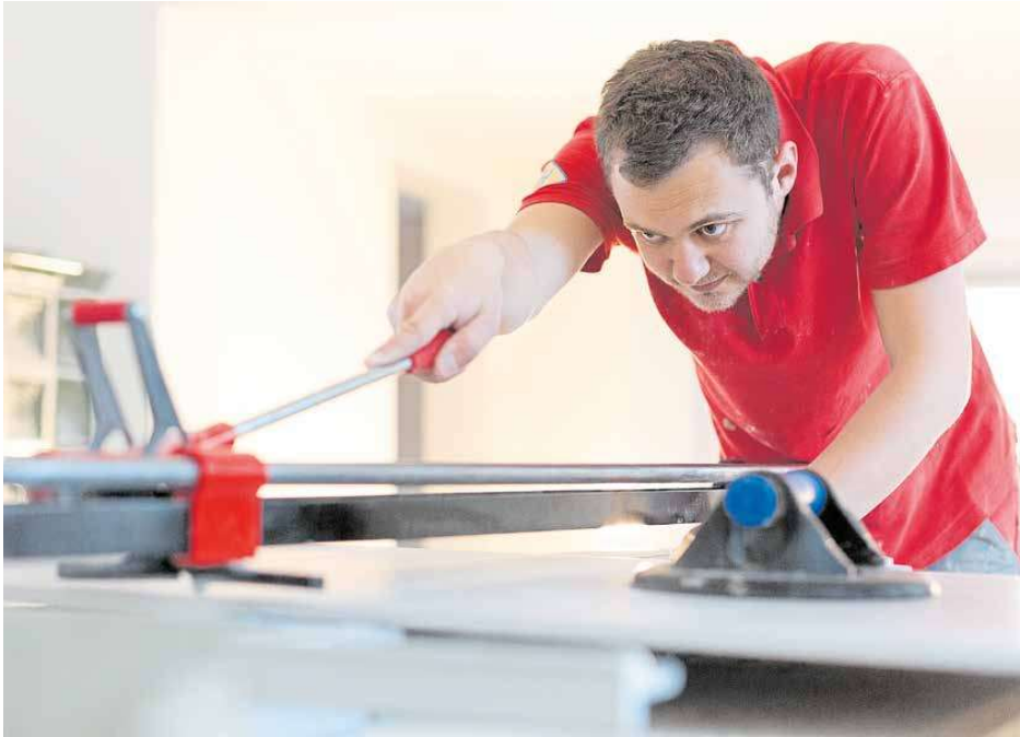
Unter anderem für Fliesen-, Platten- und Mosaikleger gilt seit Anfang 2020 wieder die Meisterpflicht. Von der Rückführung erhoffen sich Vertreter der betroffenen Gewerke unter anderem eine Stärkung der dualen Ausbildung und damit verbunden der Fachkräftesicherung.