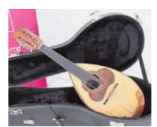
Die letzte Musikinstrumentenausstellung fand im Jahr 2015 im Meistersaal statt.

Klingende Handwerkskunst präsentiert die Handwerkskammer Wiesbaden in einer Ausstellung im Juni 2022 im kammereigenen Meistersaal. Gezeigt werden handwerklich gefertigte Musikinstrumente. Die Vernissage ist geplant für Mittwoch, den 1. Juni 2022 um 18.30 Uhr, und soll mit musikalischen Einlagen umrahmt werden. Der Ausstellungszeitraum ist von Donnerstag, den 2. Juni, bis Mittwoch, den 15. Juni 2022.