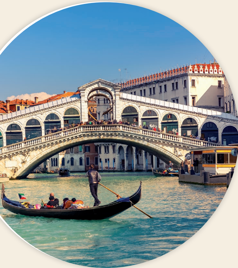
Die Rialtobrücke über den Canal Grande ist ein Wahrzeichen der Lagunenstadt Venedig.

begann, ist ein fester Bestandteil des alljährlichen Spielplans. Erleben Sie Franco Zeffirellis Inszenierung der 1871 in Kairo uraufgeführten Oper rund um die nach Ägypten verschleppte äthiopische Königstochter Aida. Die nach einer Handlung des Ägyptologen Auguste Mariette verfasste Oper in vier Akten zählt zu den bekanntesten und erfolgreichsten der Welt. Die einmalige Kulisse der antiken Arena bildet den perfekten Rahmen für diesen zauberhaften musikalischen Abend. Schliesslich werden Sie zu Ihrem Hotel zurück gebracht.